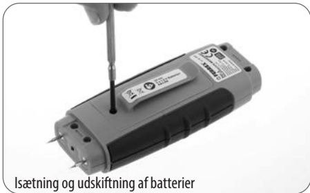
Isætning og udskiftning af batterier