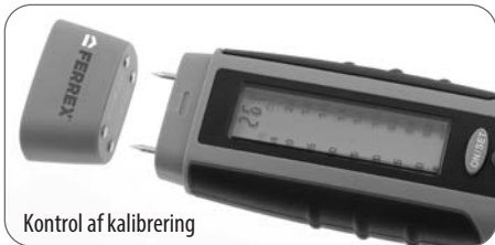
Kontrol af kalibrering